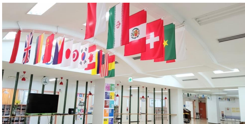
玄関：生徒・教職員の国籍の旗